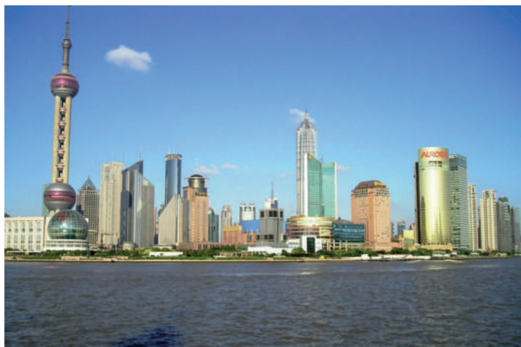
Ilustracija 3 Azijske zemlje, a posebno Kina prednjače u primjeni rashladnika vode

zemlje vodeće i po povećanju prometa koje je u odnosu na 2006. godinu iznosili 16%, što znači da je do kraja 2007. promet dosegnuo 2,4 mlrd. USD. ■