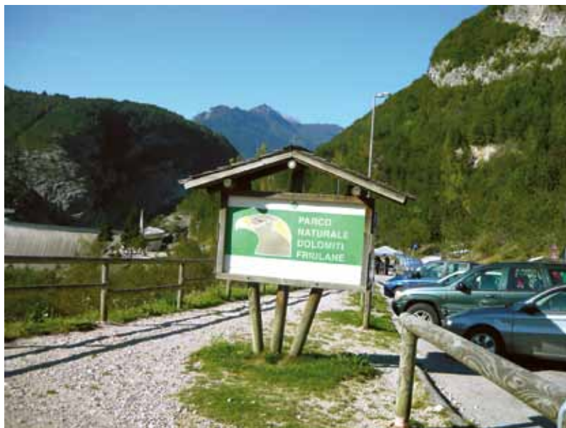
Ilustracija 2 Područje brane...

Lučna brana Vajont u Italiji je, kada je dovršena 1959. godine, s visinom 261,6 m bila najviša na svijetu (EGE 4/2011). Bila je dio velikog hidroenergetskog sustava u slivu rijeke Piave, a 9. listopada 1963. godine u 22.39 h dogodila se strašna tragedija koja je ostavila više od 2100 mrtvih, među kojima i 54 zaposlenika hidroelektrane. Odron zemlje u akumulacijsko jezero izazvao je poplavni val koji je krunu brane premašivao za više od 100 m. Val se širio uzvodno i nizvodno, dok je brana ostala gotovo cijela, a s brzinom većom od 100 km/h zbrisao je cijela naselja. Cijelo područje danas je proglašeno parkom prirode, a samo područje i branu (koja je i dalje gotovo neoštećena!) moguće je obići turistički (il. 2 - 4).