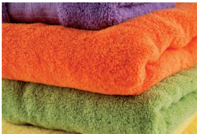
Ručnici u bojama - uvijek zanimljiv izbor