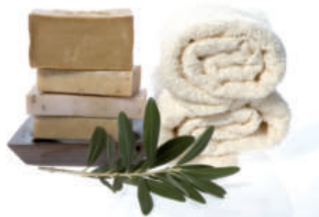
Ručnici kao mirisna rapsodija

Jesu li boje ono na što obraćamo pažnju kod kupovine ručnika? Je li to možda njegov sastav ili veličina? Moglo bi se reći kako najprije razmišljamo o sastavu ručnika. Ručnik mora biti mekan, fin i na dodir ugodan. Pamuk je najčešći materijal od kojeg se izrađuju ručnici. On je ugodan na dodir i prirodan te je vrlo otporan na visoke temperature pranja. Tkani frotir također može biti dobar odabir, a danas se sve češće pronalaze ručnici koji u sastavu sadrže bambusovo vlakno. Ručnici izrađeni od bambusovog vlakna na dodir su izuzetno mekani, imaju veliku moć upijanja, ljepše prijanjaju uz tijelo od pamučnih i manje se gužvaju. Bambusova vlakna mekana su poput svile pa ručnici izrađeni od ovog materijala djeluju profinjeno pa tako neupitno postavljaju nove standarde u izradi ručnika.