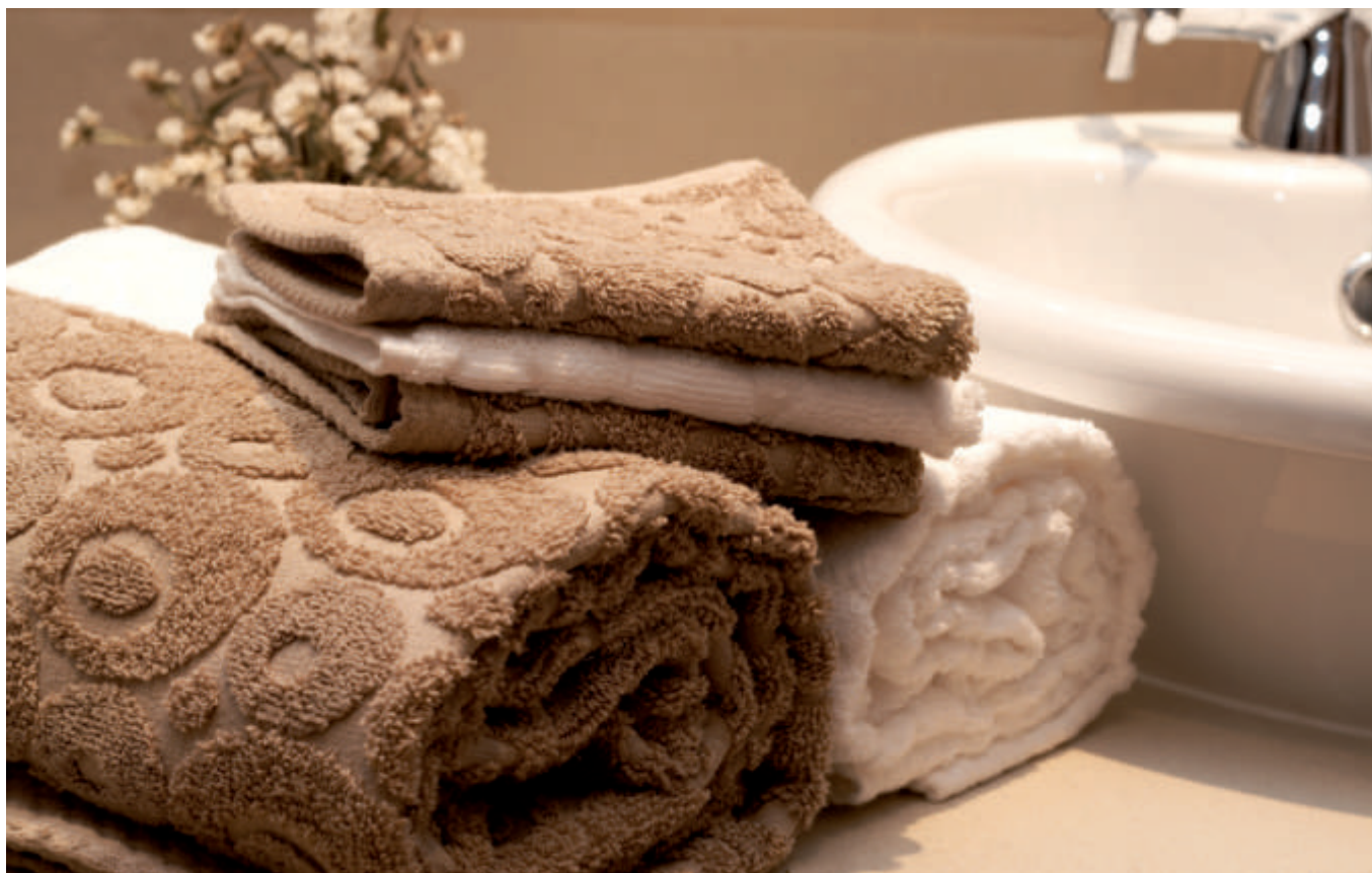
Ručnici mogu upotpuniti izgled kupaonice